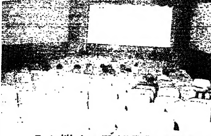
الشاشة بيشاء والمصالة غارفة-لا من بعض المغامرين